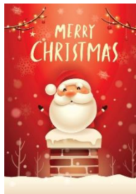
Hugging Santa 聖誕老人