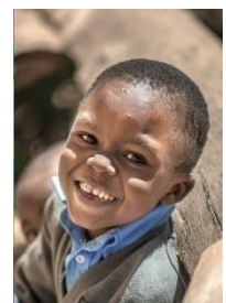
Happy boy 快樂小男生