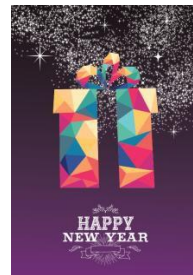
Near Year 新年快樂