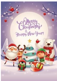
Christmas Wonderland 歡聚聖誕

B) Pick a Card 選購禮物之同時，請你挑選以下其中一款心意卡，送給你的親友：