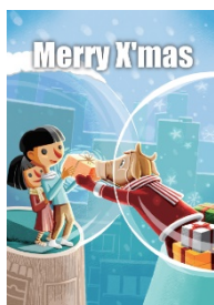
Merry Christmas 聖誕快樂

B) Pick a Card 選購禮物之同時，請你挑選以下其中一款心意卡，送給你的親友：