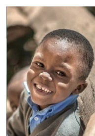
Happy boy 快樂小男生