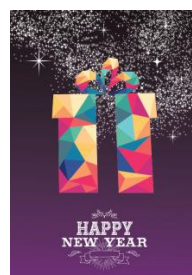
Near Year 新年快樂