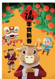
Chinese New Year 新年快樂