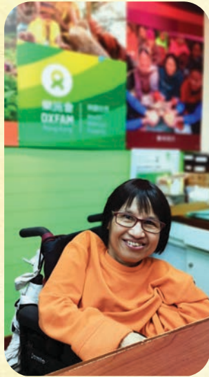
阿妙在樂施會已服務了三十年。

三十年前，一個初出茅廬的女孩懷著興奮又戰戰兢兢的心情，踏足樂施會當時設於大角咀的辦公室，開始人生第一份工作。這份工作，令她脫離領取綜援的日子，找到自己的存在價值。三十年過去，女孩繼續在這工作崗位上默默耕耘。