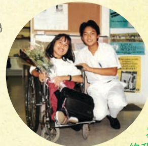
九十年代，阿妙與義工攝於樂施會當時在大角咀的辦公室。阿妙笑說：「好感恩可以和合作過的義工成為好朋友。他們常常約我飯聚呢。」