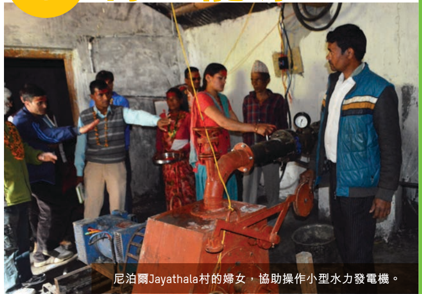
尼泊爾Jayathala村的婦女，協助操作小型水力發電機。

再生能源不單大大改善村民的生活，更為他們開闢新的發展機遇。現在，小農可輕鬆獲得灌溉用水，灌溉更多農田，提高收成。整個項目由當地婦女主導，她們積極參與項目管理、系統操作和保養，並向其他農戶解釋有關計劃。有了電力，婦女不用每日花數小時上山砍柴，她們使用電飯煲煮飯，將時間用於發展生計、照顧子女和參與社區發展。兒童也不用摸黑溫書了。