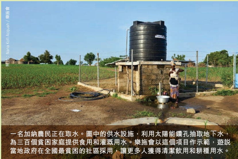
一名加納農民正在取水。圖中的供水設施，利用太陽能鑽孔抽取地下水，為三百個貧困家庭提供食用和灌溉用水。樂施會以這個項目作示範，遊說當地政府在全國最貧困的社區採用，讓更多人獲得清潔飲用和耕種用水。