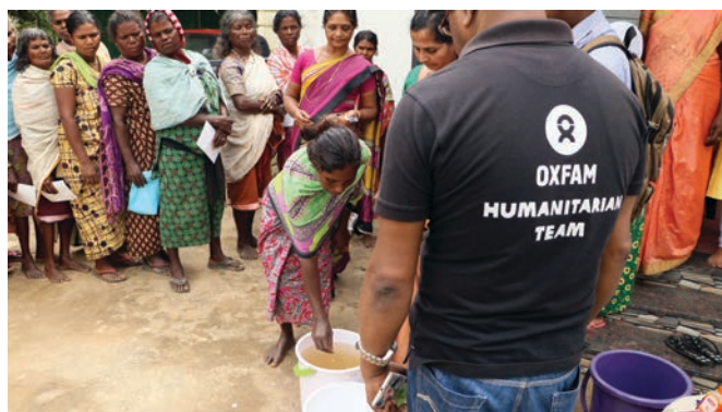
樂施會的工作人員和志願者向災民示範如何使用淨水丸。