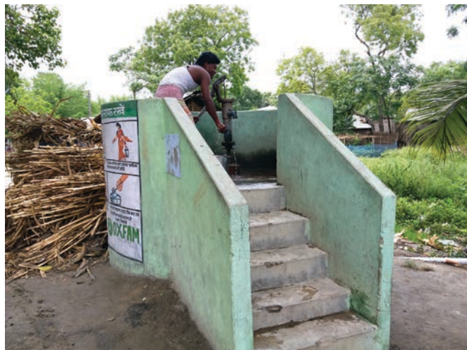
修復水井，加高地台，可減低風季時洪水污染水源的風險。